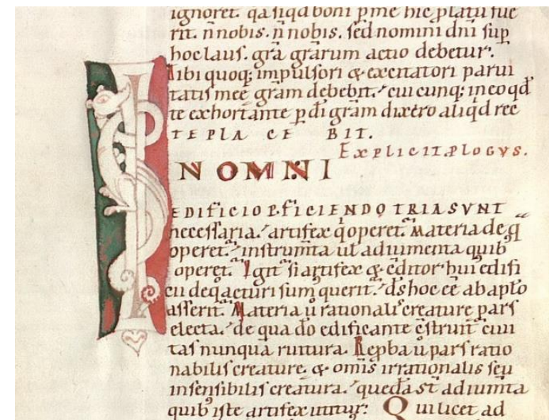
Gerhoch von Reichersberg, Opusculum de aedificio Dei München, BSB, Clm 5129, fol. 3v

UNIVERSITÄT HEIDELBERG ZUKUNFT SEIT 1386